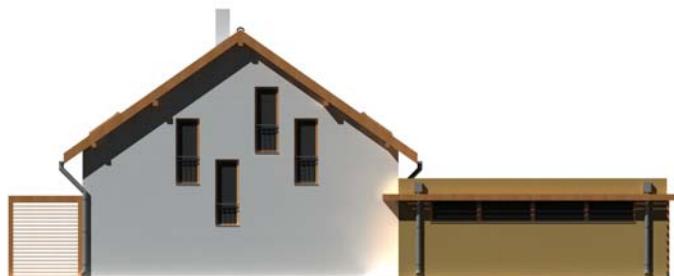
POHLED BOČNÍ (GARÁŽ)